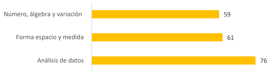
% de aciertos en unidad de análisis: matemáticas